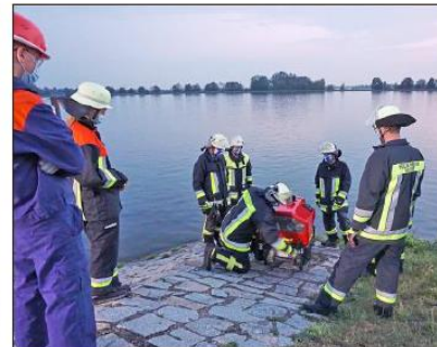
Die Maschinisten sind für die Inbetriebnahme der Pumpen zuständig.